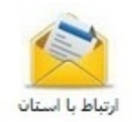
ارتباط با استان

لیست انتخابات فعال (جهت شرکت در انتخابات بر روی عنوان انتخابات کلیک کنید)